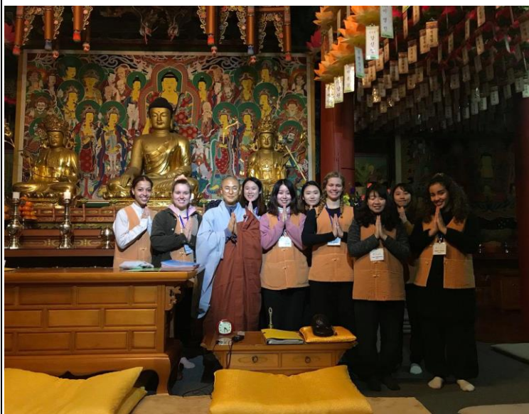
四個國家的交換生參加韓國傳統體驗 Temple stay

因為課修的少，所以大部分的時間我都用來旅遊，每個月至少去了一個城市，在最後一個月我甚至去了四個城市，我想既然都出國了就更用心體會世界的不一樣，才會到處旅遊。我覺得除了旅遊以外和外國朋友一起玩也是讓我印象深刻的，交換學生不乏有美國、日本、新加坡、馬來西亞、烏茲別克等等國家，我喜歡和他們一起聊天，一起出去玩，一起說和自己國家的不同之處，和他們變成朋友是我在交換的旅途中得到最珍貴的回憶之一。