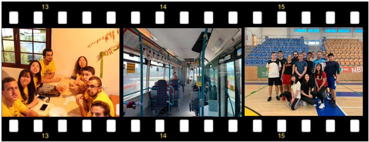
左圖: Survival Weekend