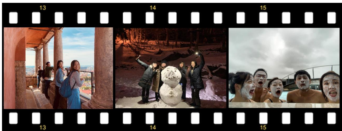
左圖：小鎮上的 White Tower 中圖：滑雪課時堆的雪人 右圖：台日交換生同遊冰島行

也很謝謝東華大學與教育部學海飛颺計畫和我的家人在交換的路上支持著我，讓我勇於築夢，學習獨立的同時也擴展國際視野！還在看這篇文章分享的你也趕快鼓起勇氣申請看看吧，給自己一個機會踏出舒適圈，體驗並用心去感受在異地的生活，一定會有許多新的體悟，趁著年輕好好把握這個機會當你還是學生的身分去闖蕩吧！如果有任何問題都歡迎來信提問交流喔！