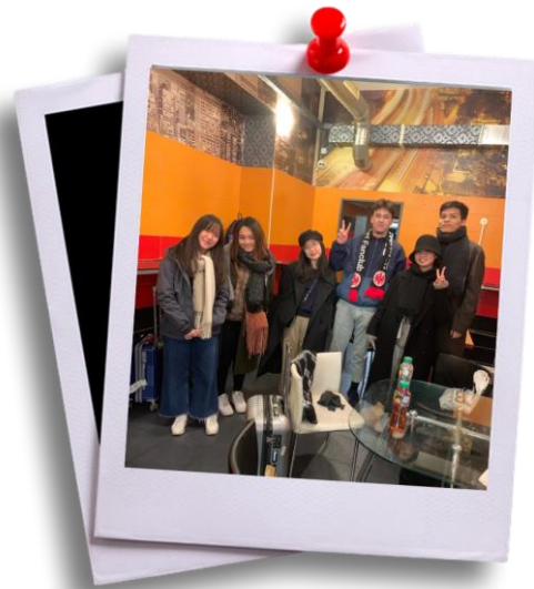
右圖: 在旅途中認識了日本、越南還有俄羅斯人