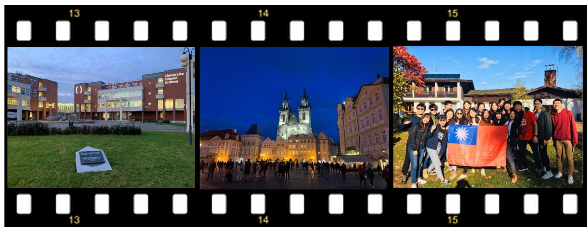
左圖：University of Hradec Králové 中圖：布拉格 右圖：UHK 台灣交換生大合影