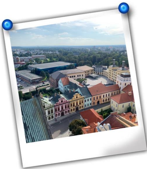
左圖: 在 White Tower 上俯瞰 HK 小鎮