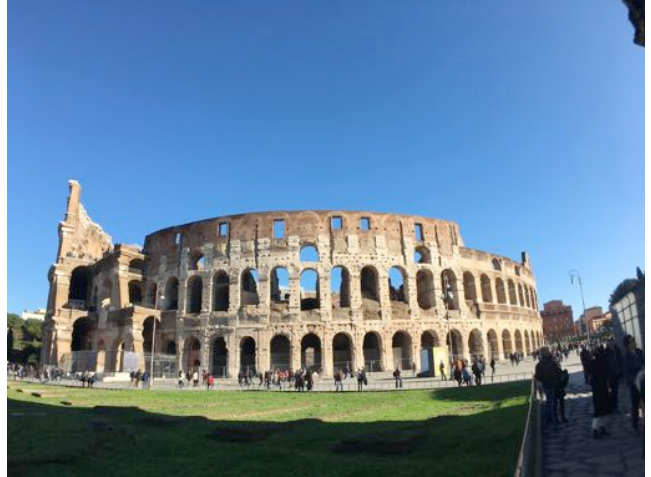
義大利 羅馬競技場