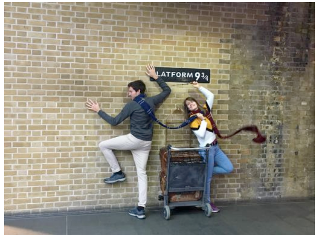
英國 九又四分之三月台