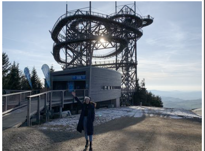
捷克 Sky Walk