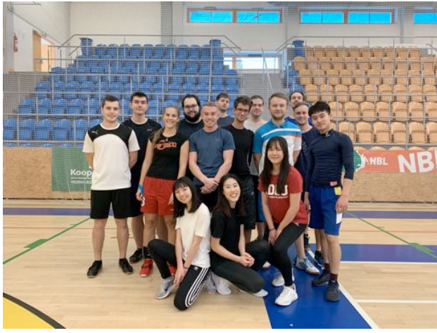
和排球課同學合照