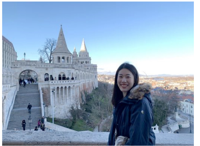
匈牙利 布達佩斯 漁人堡