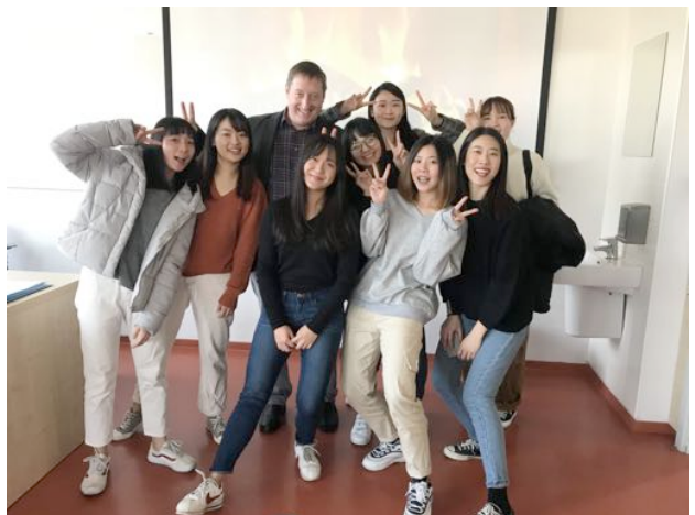
English in Practice 與老師合照