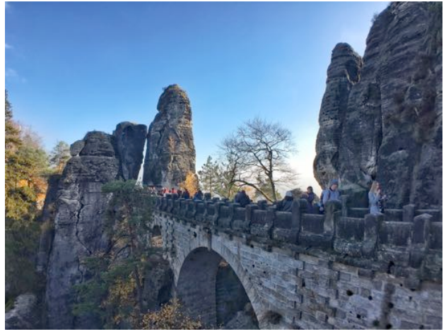
Saxon switerland national park