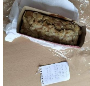
打掃叔叔送我的香蕉泥杏仁蛋糕