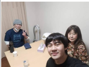
打掃阿姨因為家裡因素，在 8 月中的時候就要離職了，因此我們找個機會一起吃午飯