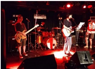
輕音部第一次新生成發

因為篇幅的關係，大概就介紹到這邊，千言萬語說不盡，這次的交換收穫很大，如果有其他任何問題，歡迎聯繫我。