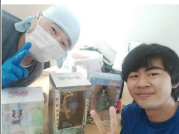
在回去的前一周，打掃叔叔送我兩盒化物語景品，回去的最後一天回送一盒賽馬娘的景品。