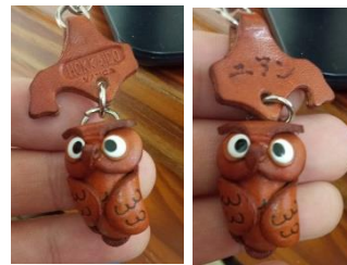
打掃阿姨最後送我的北海道貓頭鷹的手機吊飾，背後刻著我的名字