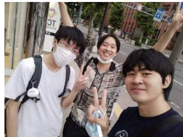
與輕音部團員一起去唱歌