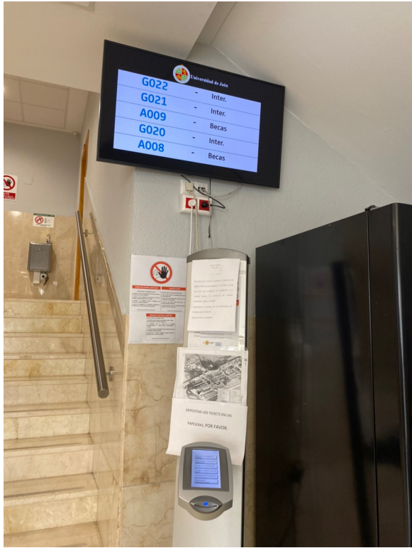
Planta Bajo 拿號碼牌