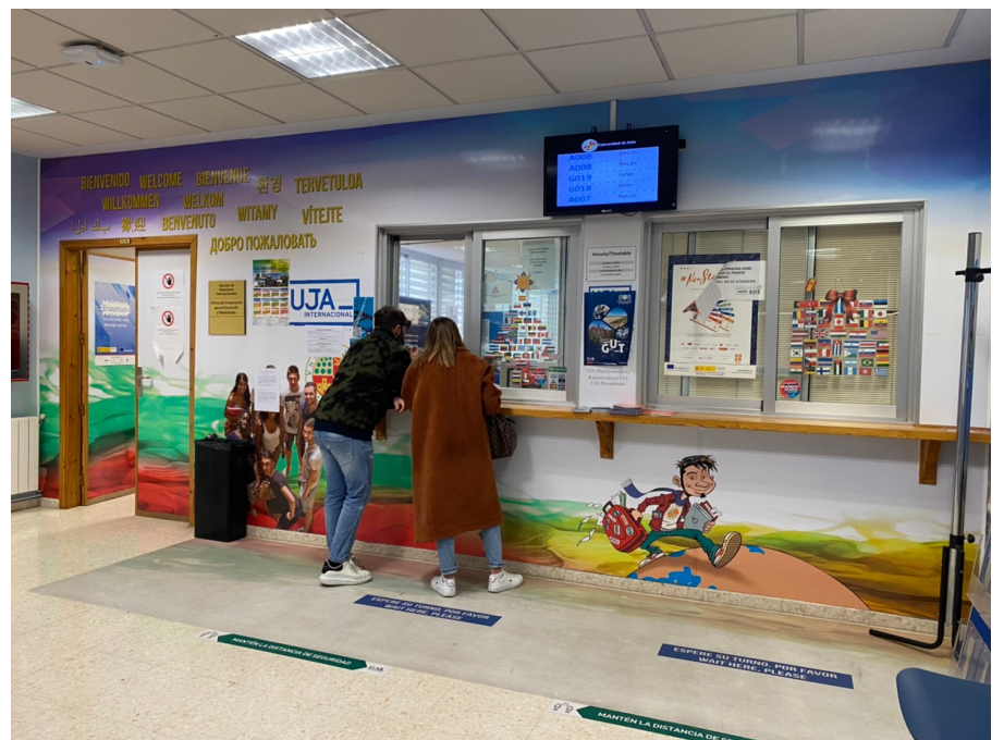
Planta Primera 國際處窗口

如果想使用學校的健身房或是上運動課程的話，要到Colegio Mayor裡的辦公室辦運動卡(Tarjeta de deporte)；然後再用運動卡上網預約想要的課程或健身房時段。付費的話可以選擇上一堂付一堂，也有直接付整個學期或是一個月用到飽的方案；基本上用學校的運動資源會比外面的課程和健身房便宜非常多，所以如果想定期運動還蠻推薦可以使用的。