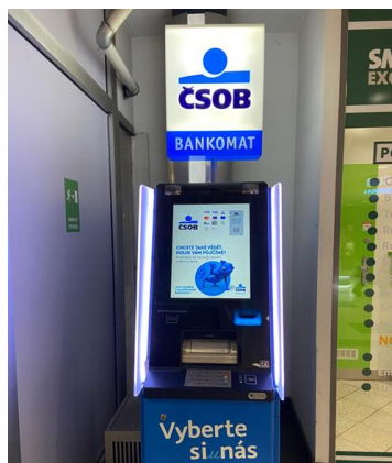
繳 Vodafone 電話費的 ATM

議如果是說要 5000 捷克克朗可以等不同櫃台人員價錢有可能會不一樣。如果沒有捷克帳戶拿回訂金，可以再辦理的時候要求帳單直接從訂金扣(聽其他交換生說可以這樣)。在 Futurum 進去左手邊有一台藍色的 ATM 可以支付 Vodafone 電話費，因為實體付費需多 70 捷克克朗推薦就在這裡繳費。