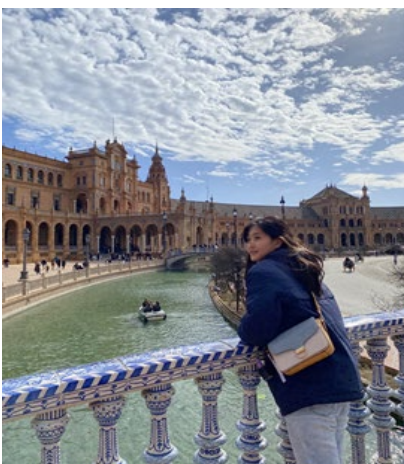
Plaza de España- Seville, Spain