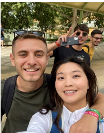
Italian friends from pizza city-Naple