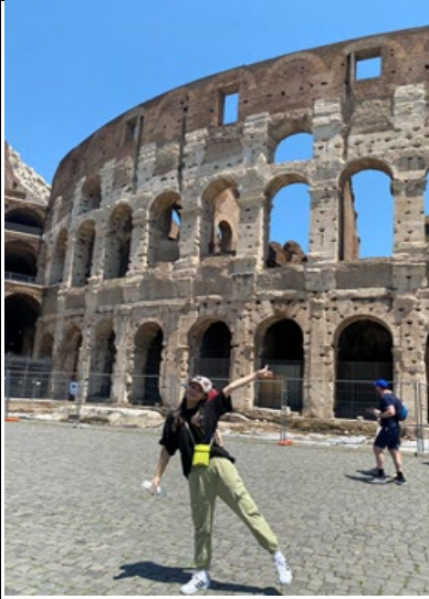
The Roman Coliseum-Roman, Italy