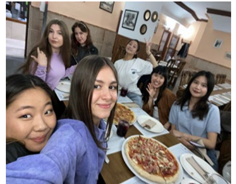
Final dinner with Ukrainian girls