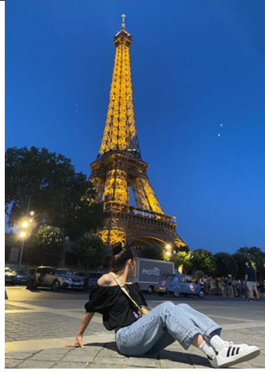
Eiffel Tower-Paris, France