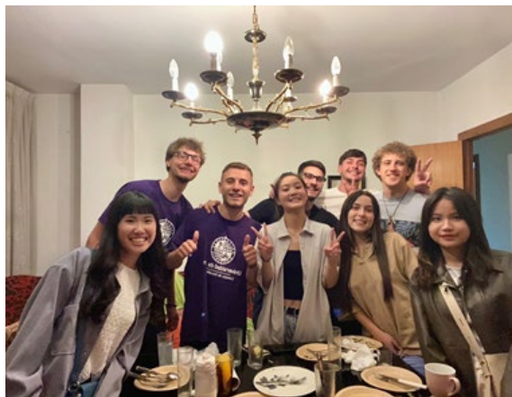
Exchange traditional food- have fun with these guys