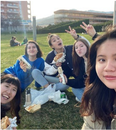
Kazakhstan roommate and Turkish girl