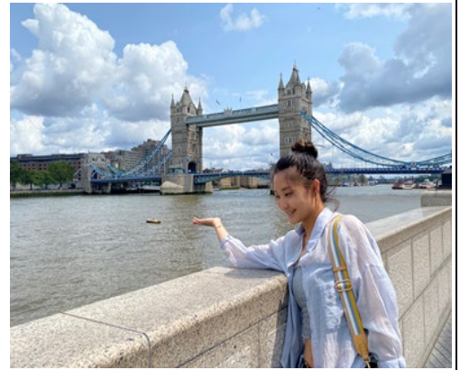
Tower Bridge-London, UK