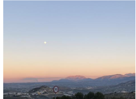
Las paisajes de las ciudades he visitado