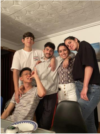
Mis compañeros de piso y yo