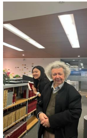
(很像愛因斯坦的法國文化老師)