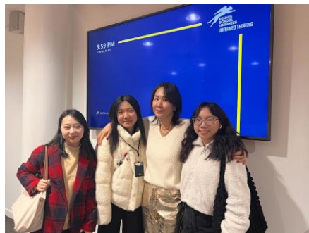
(和香港老師的合照)